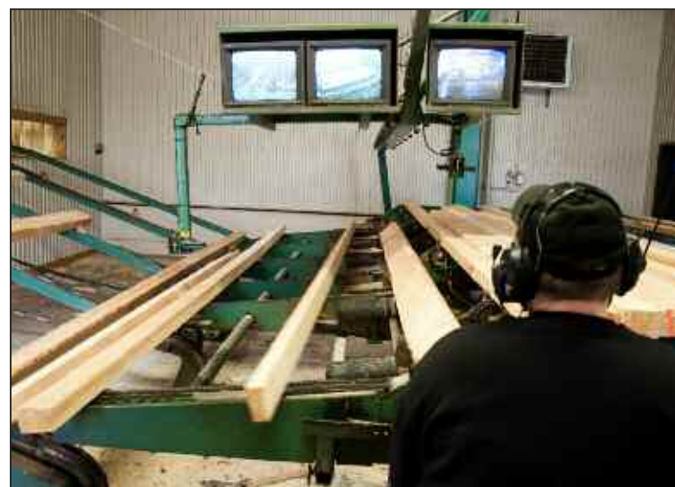
60 000 kubikmeter sågad vara lämnar varje dag sågverket i Eneyryda.